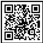
민소법 라이브러리(소송기록 등)